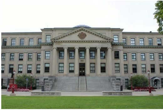
Figure 2: Pavillon Tabaret à l'Université d'Ottawa.