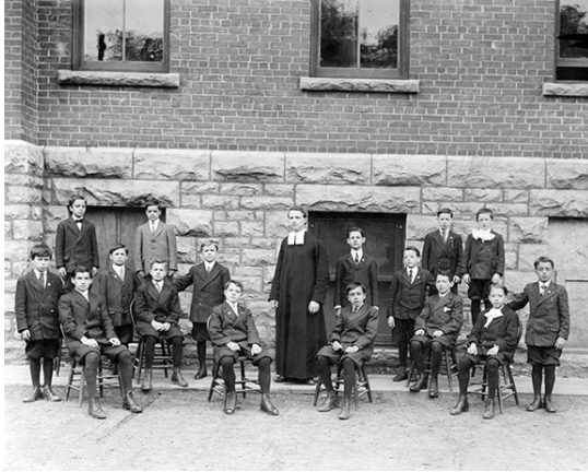
Figure 1: Un groupe d'élèves avec leur professeur à l'extérieur de l'école Guigues en 1905